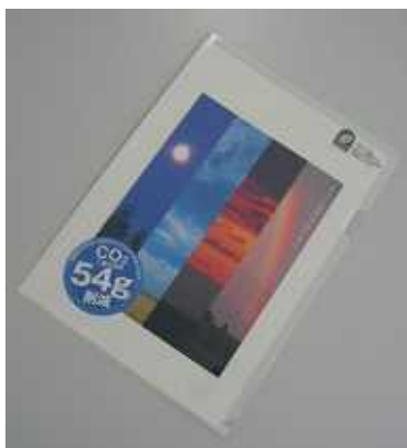
デザイン2:大いなる自然