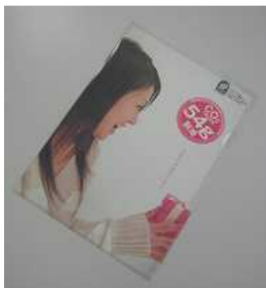
デザイン1:女性の横顔