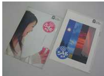
シート化、印刷・加工を経て クリアファイルの完成！ もう一度資源として有効利用

Pointその1 エコリーフマーク付きの、環境負荷に配慮して作られたクリアファイルです。