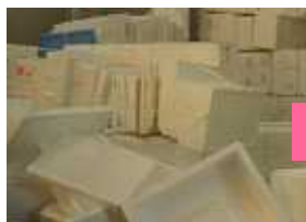
市場から回収された 魚箱発泡スチロール