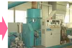
ラベルをきれいに除去して、 再生原料へリサイクル